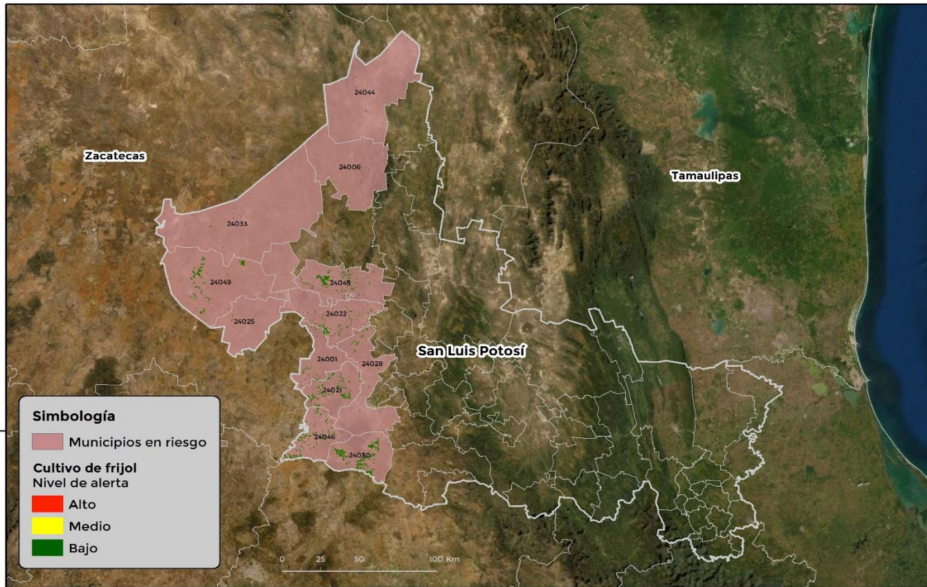
Municipios con cultivo y probable riesgo por Conchuela del frijol en San Luis Potosí

GEOMATICA-D3-SENASICA © 2021 AFC FECHA: 01-JUNIO-2021